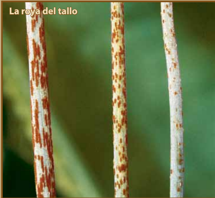
Figura 3. Ejemplos de la variabilidad en síntomas causados por la roya del tallo (abajo), la roya de la hoja (superior derecho), y roya amarilla o rayada (inferior derecho).

Las tres enfermedades tienen interacciones singulares con las variedades más comunes de trigo y cebada. Estas interacciones pueden modificar los síntomas de la enfermedad resultando en la reducción del tamaño de la lesión y variable en la cantidad de tejido amarillo o canela que rodea las lesiones (Figura 3). La familiarización con el rango de posibles síntomas para estas enfermedades mejorará la exactitud del diagnóstico y el manejo de estas enfermedades de importancia económica.