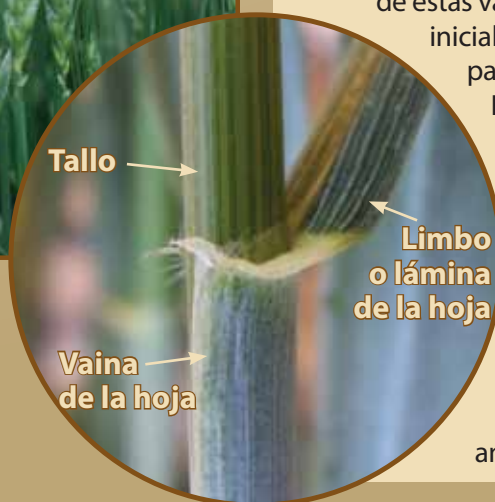
Figura 1. El diagnóstico de las royas requiere de un entendimiento básico de la anatomía vegetal y una revisión rápida de esta información puede mejorar la exactitud del proceso de identificación.

Una vez más, después de varias décadas de control con variedades resistentes a la enfermedad, nuevas razas de la roya del tallo están amenazando a la producción de grano en algunas partes del mundo. El primero de estas variantes, conocida como "Ug99", fue inicialmente reportado en los siguientes países del este africano: Uganda, Kenia, e Etiopía. Variantes adicionales también han emergido, complicando aún más los esfuerzos para contener el problema. La enfermedad continúa extendiéndose y quizás muy pronto amenace a la producción de trigo y cebada de Norteamérica. La detección rápida de nuevas razas es un componente importante de la respuesta internacional a estas amenazas de enfermedades emergentes.